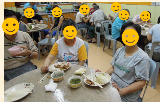
🌸 住宿及膳食服務 🌸