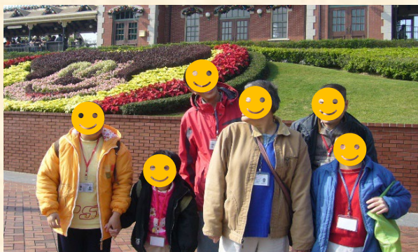
🌸 社區活動 🌸

長康之家成立於1996年11月，為41位中度智障人士提供住宿服務。我們透過家居化的生活環境設計，使服務使用者(舍友)享有舒適和安全的居住空間，為他們提供多樣化的生活體驗，滿足他們身、心、社、靈的需要，達至全人發展。