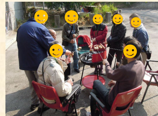
🌸 社交及康樂活動 🌸